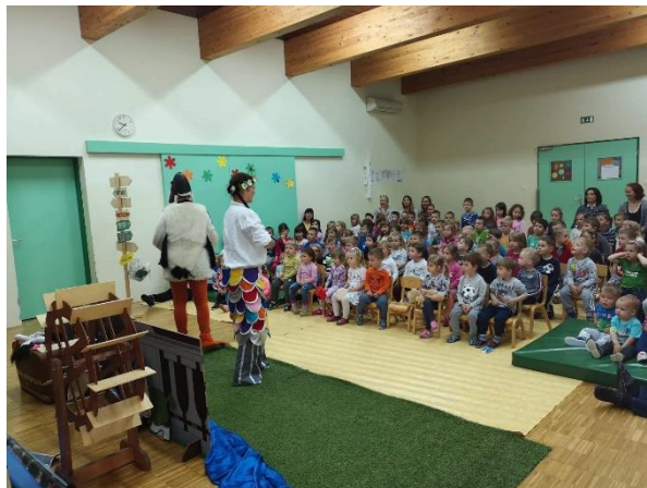
Kulturna predstava za vrtec

Ob 210. letnici Osnovne šole Hajdina je bila izdana tudi posebna monografija, k izdaji katere je sklad prispeval 100 evrov.