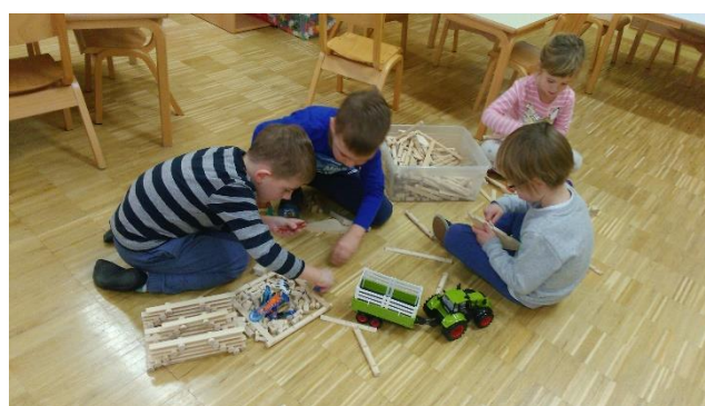
Nove igrače v vrtcu

Za otroke rumene in zelene igralnice je sklad financiral nakup lesenih gradnikov (81 kosov) v vrednosti 236,68 evrov, za njihovo vsakodnevno igro, spodbujanje domišljije in sodelovalno igro z vrstniki.