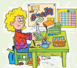
Tabela 11: Naravoslovni dnevi 2024/25

Učenke in učenci aktivno in sistematično dopolnjujejo in poglobljajo teoretično znanje, ki so ga pridobili med rednim poukom, in ga povezujejo v nove kombinacije. Dejavnosti jih spodbujajo k samostojnemu in kritičnemu mišljenju, omogočajo uporabo znanja ter spoznavanje novih metod in tehnik raziskovalnega dela.